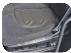
כסא נהג פנאומטי ברמת גימור גבוהה, בעל דרגות כיוון שונות וחימום חשמלי