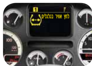
לוח שעונים בעברית