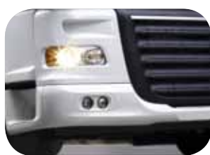
פגוש מחוזק ומגן רדיאטור קדמי