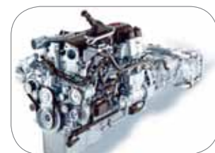
מנוע 12.9L חדשני וחסכוני