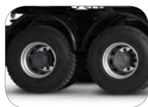
הכתה טבורית בסרנים אחוריים