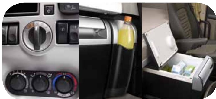
הדסת אנוש מתקדמת ונוחות מירבית לנהג