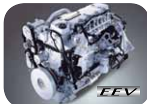
מונע העומד בתקן זיהום אוויר EURO5/EEV