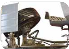
זווית הפניה של 52°, מאפשרת קוטר סיבוב מינימלי