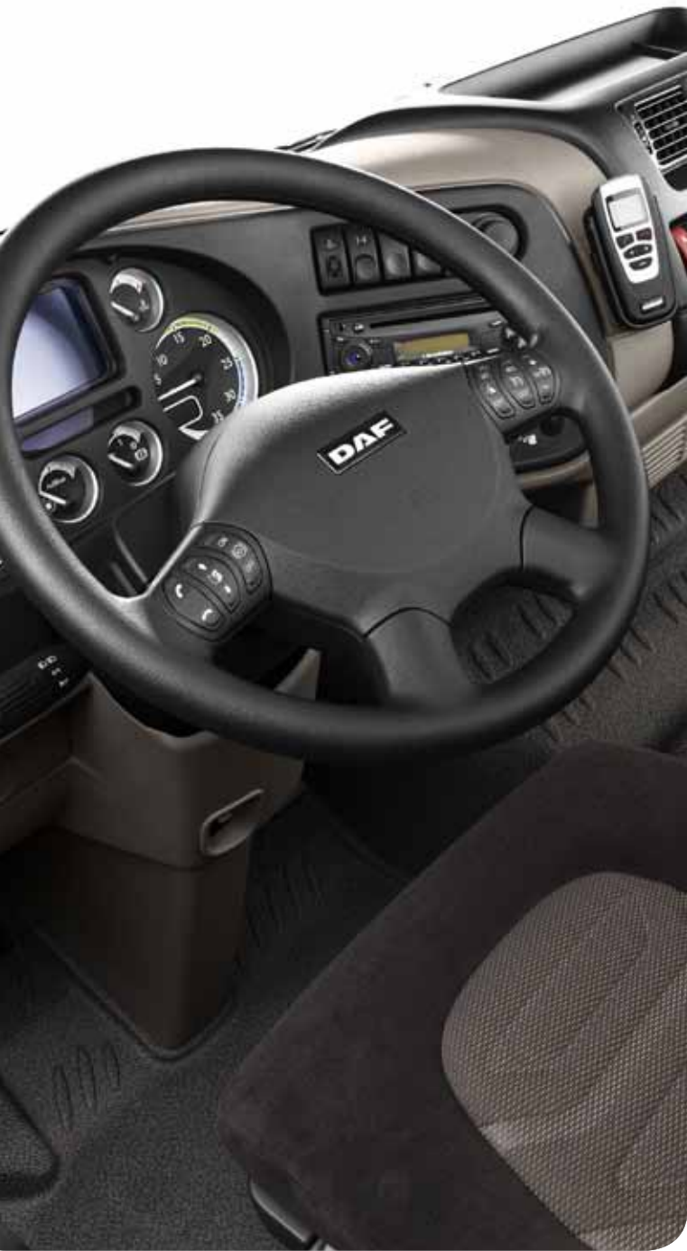
* התמונות להמחשה בלבד ביתן להזמין: פריטים בתוספת תשלום.