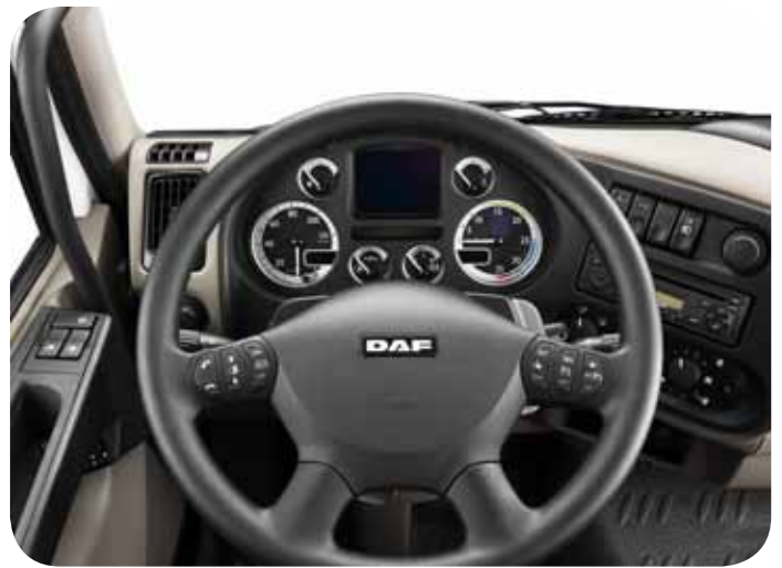
הגדסת אנוש ונוחות נהיגה