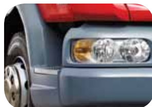
פגוש פלדה עם פנסים שקופים