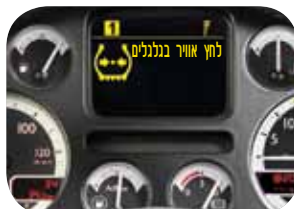
לוח שונים בעברית