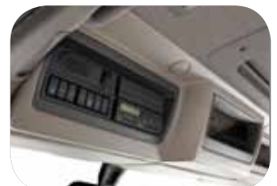
טכוגרף ממוקם מעל ראשו של הנהג