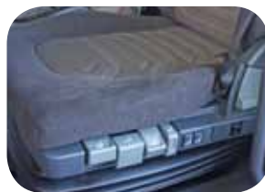
כסא נהג פנאומטי ברמת גימור גבוהה, בעל דרגות כיוון שונות וחימום חשמלי