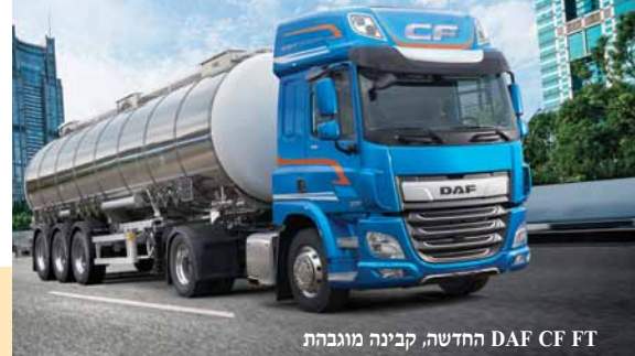
ה-DAF CF FT החדשה, קבינה מוגבהת