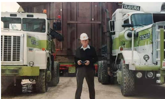
...ועם המשאיות ההיסטוריות של תעבורה, יובל שנים לאחר מכן

בארץ החל בונדי לעבוד כמכונאי, ובכסף שחסך פתח בנתניה בית מלאכה קטן, שהפך עם הזמן למוסך.