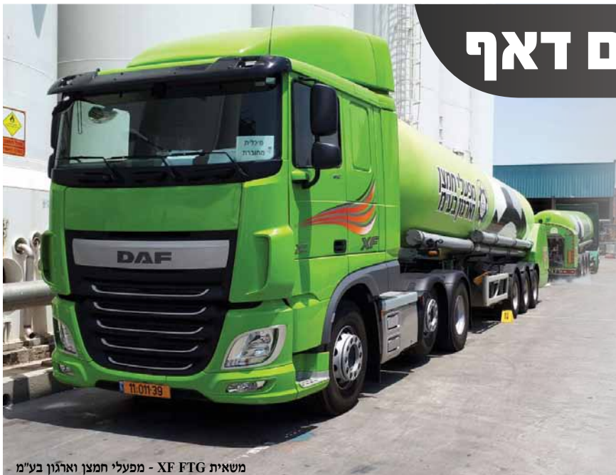
משאית XF FTG - מפעלי חמצן וארגון בע"מ

מרבית הגזים התעשייתיים, המשונעים במדינת ישראל, מגיעים ליעדם באמצעות דאף. זה קורה בזכות צי המשאיות והמיכליות של קבוצת "מפעלי חמצן וארגון בע"מ", שבחרה בדאף כמשאית המובילה וב"תשתית" כשותפה לדרך.