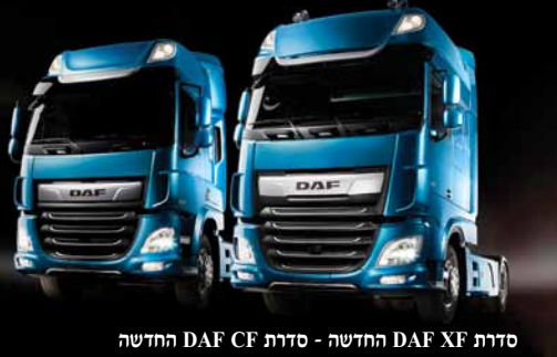
סדרת DAF XF החדשה - סדרת DAF CF החדשה