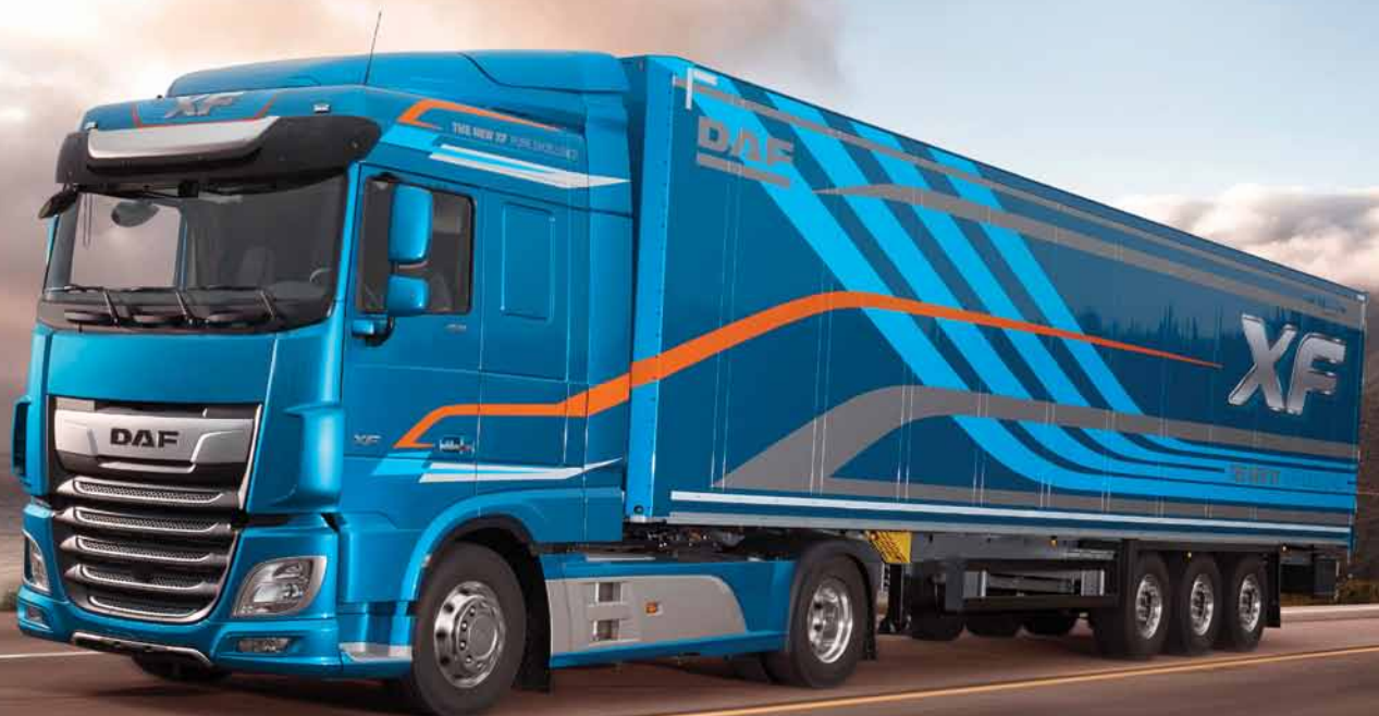
DAF XF FT החדשה, קבינה מוגבהת

המשאיות הטובות ביותר בשוק, הן מעתה טובות עוד יותר: זו הבשורה היוצאת מבית דאף העולמית, שהשיקה קו חדש ופורץ דרך של משאיות כבדות CF ו-XF. רגע לפני שהן עולות על כבישי הארץ - כל מה שרציתם לדעת על המשאיות החדשות. יש למה לחכות!