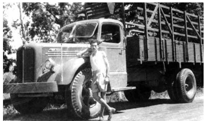
בונדי עם המשאית הראשונה, בסוף שנות ה-40...